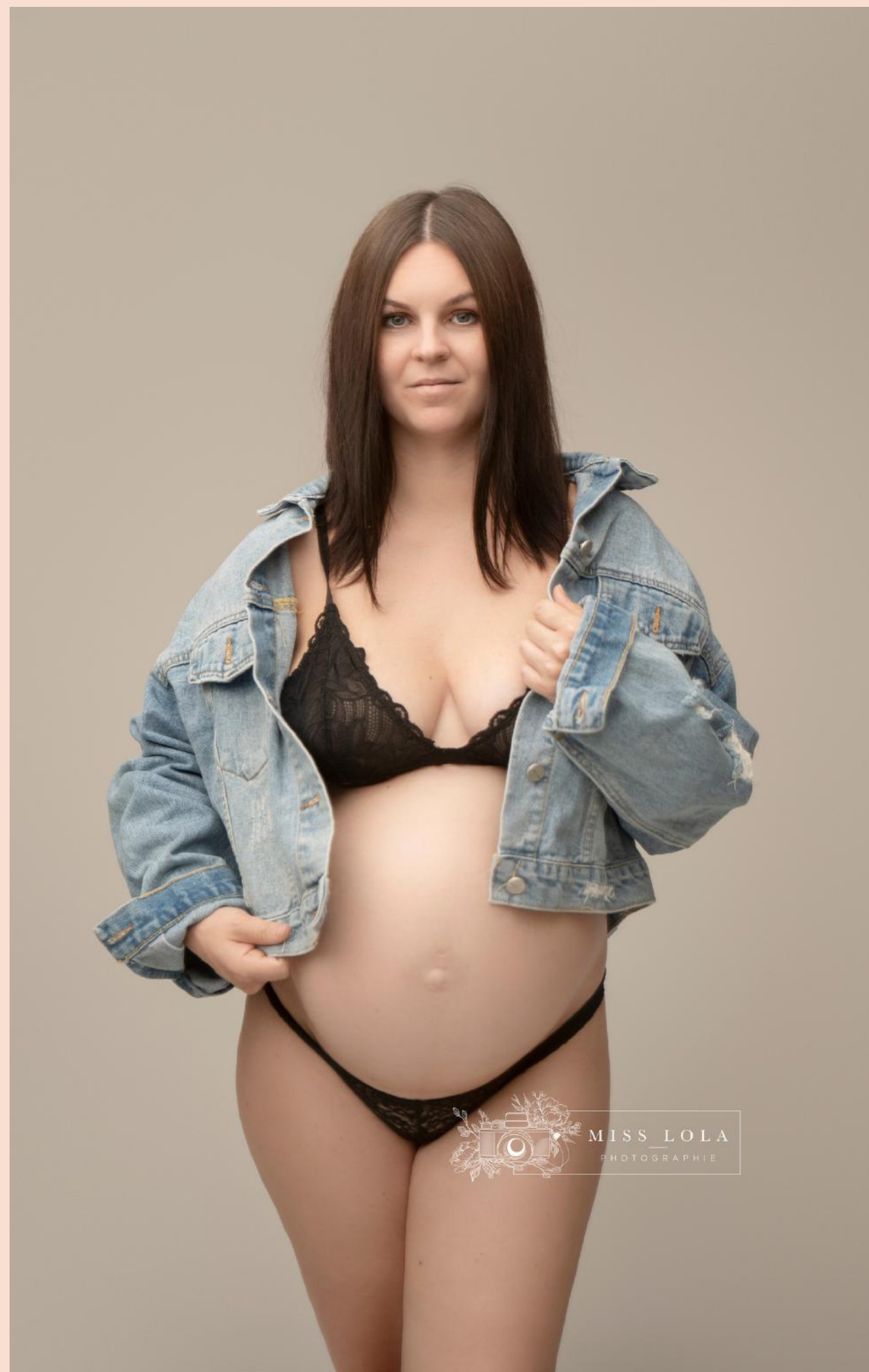
La veste en jeans